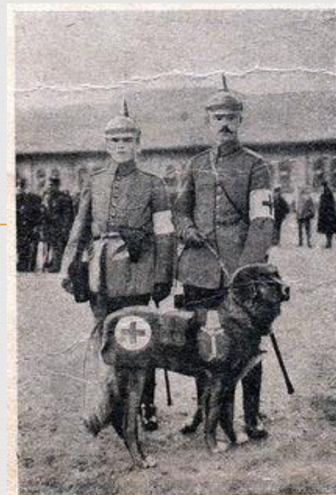
Собака-санитарь на службе в германской армии.