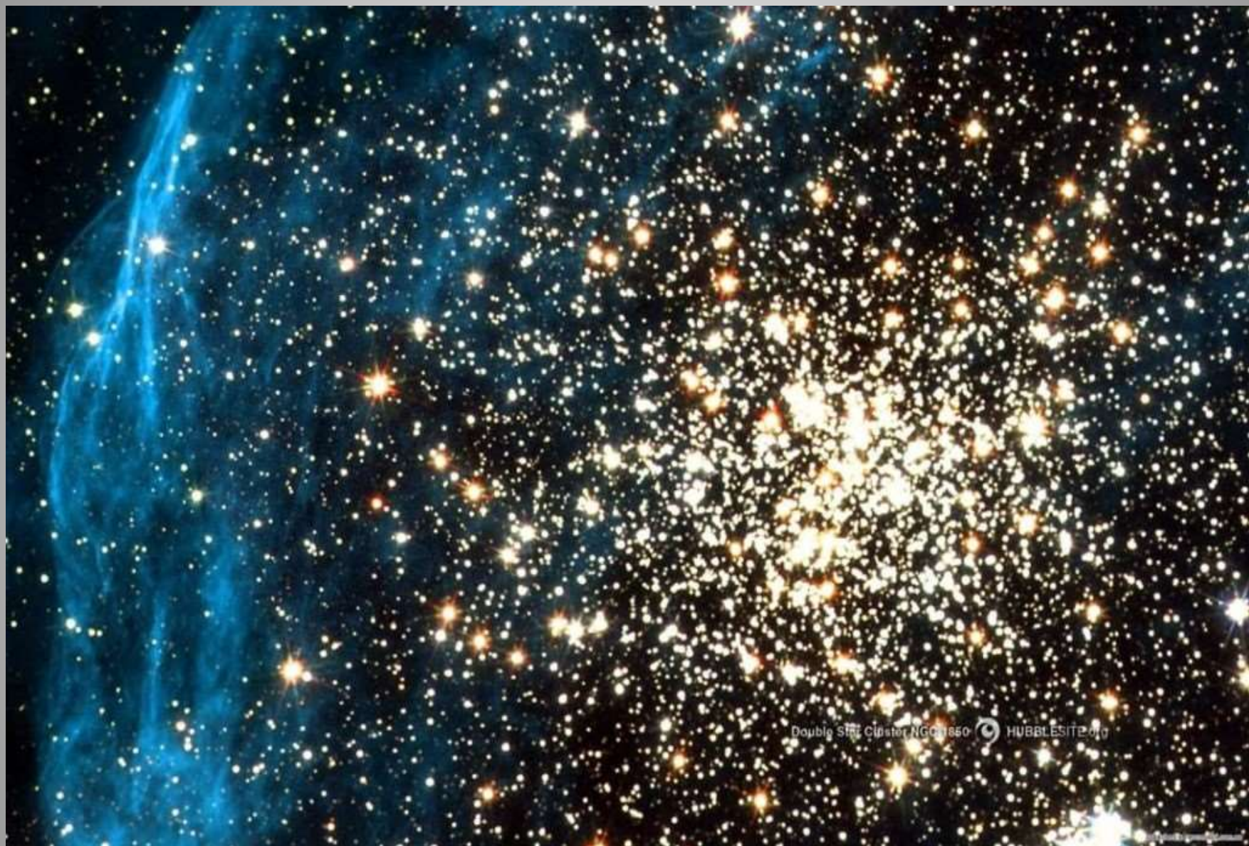
Double Star Cluster NGC 1850