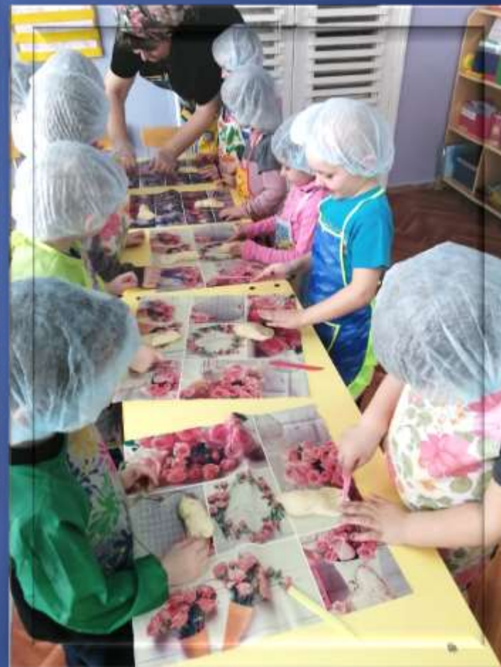
Работа с тестом